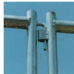
Horné spojenie dielcov